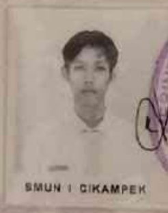
SMUN 1 CIKAMPEK