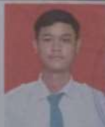
SMK DARUL MA'ARIF

Kel. P : Pengetahuan K : Keterampilan NA : Nilai Akhir